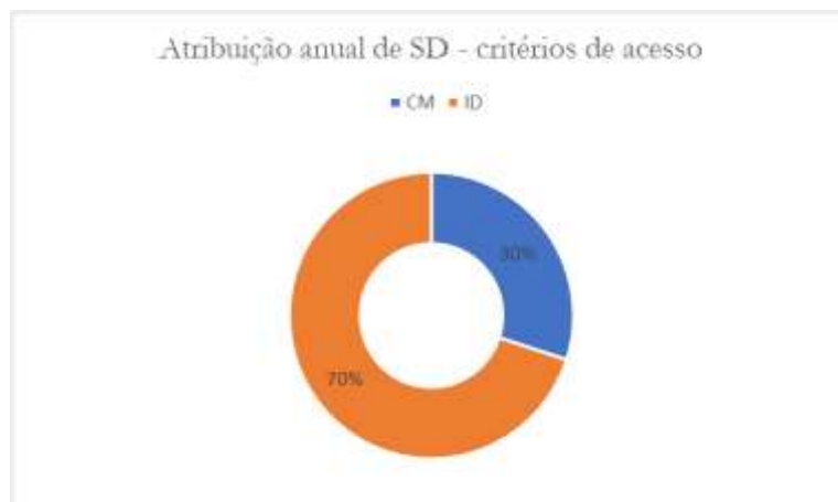
Figura 1: Alocações básicas e de desempenho de SDM

O Projecto irá apoiar 4 ciclos das SDM's. Os fundos disponíveis para as SDM's são pré-determinados por ano conforme indicado na tabela abaixo.